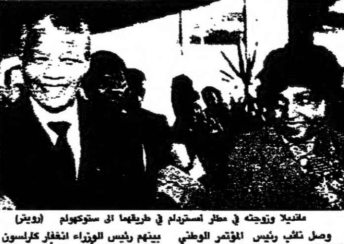
مفتاحا وزوجته في مطار استرداد في طرهما الى ستوكهولم